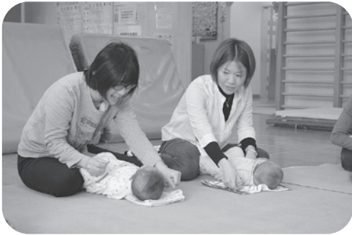
「子育て支援事業 「びよびよハウス」