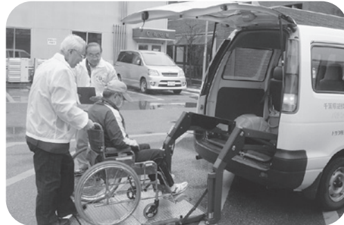
福祉カーの乗降の様子