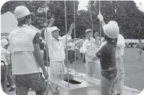
「災害ボランティアセンター 立上げ訓練」仮設トイレ設置」