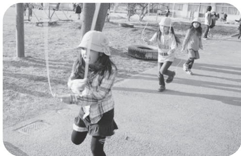
こどもルーム (写真は中央小ルーム)