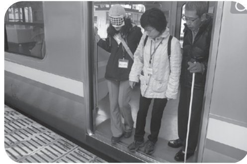
「ボランティアスクール 「誘導ボランティア養成講座」