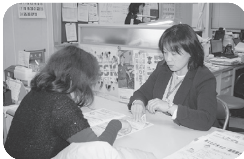
地域包括支援センター